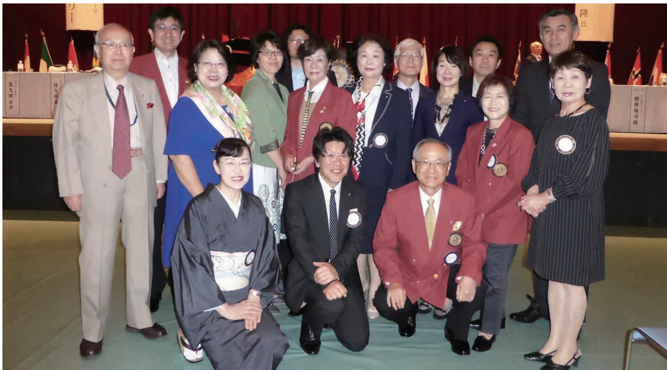
地区大会本会議がユラックス熱海で開催されました