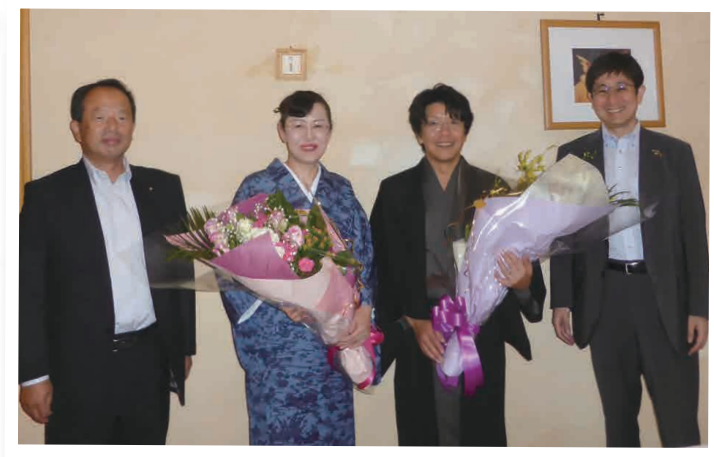
花束贈呈 一年間頑張ってください