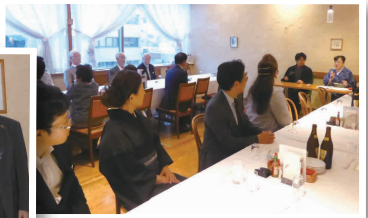
ピアチェーレでの夜の例会風景