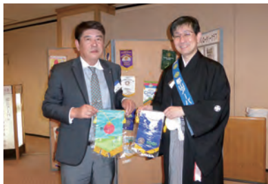
富来RCとのバナー交換