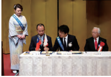
佐久間英一ガバナーエレクト立会いの下に調印式が行われました