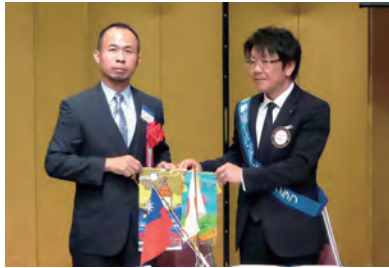
新竹東北区RCとのバナー交換