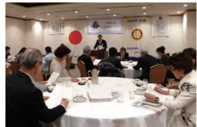
記念式典に向けて綿密な話し合いが行われました

県外からのお客様は、台湾の新竹東北区RCから13名、岸和田東RCから10名、東京六本木RCから3名、小牧RCから1名、幸手中央RCから7名、富来RCから6名が来られます。県内からは、いわき桜RCから4名、中央分区の会長・幹事、パストガバナーが8名来られる予定です。皆様のご協力をよろしくお願いいたします。