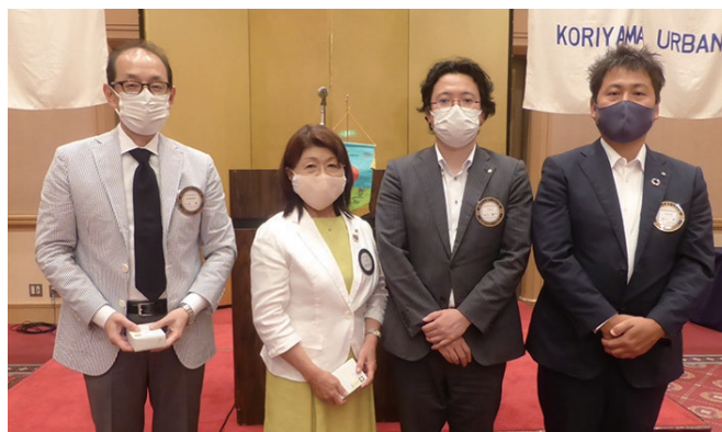
新旧会長幹事バッジ交換