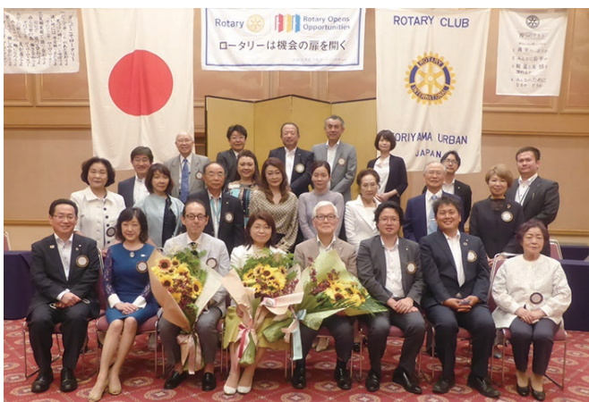
会長幹事に花束贈呈・記念撮影