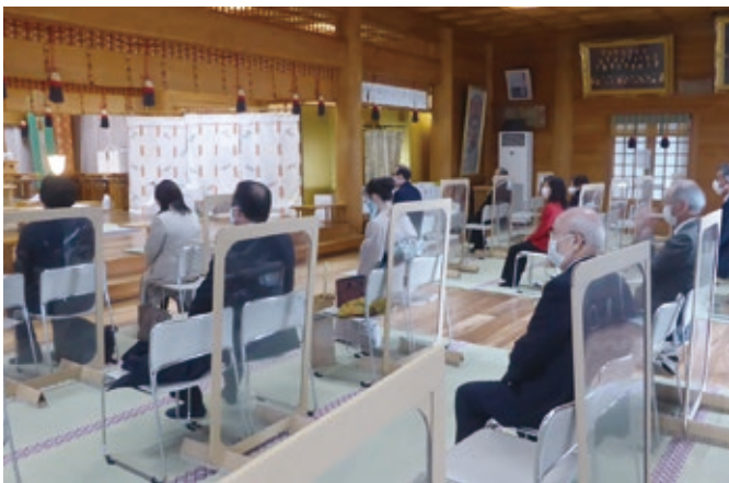
感染防止対策の中で新年祈禱